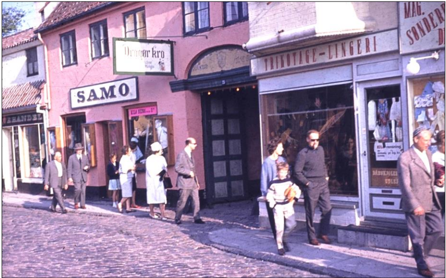
Tresserne. Kongevejen ved indgangen til Dragør Kro.

illustration af selvsamme barndom og ungdom. Litteratur om det samfund, vi voksede op i, var også spændende læsning.