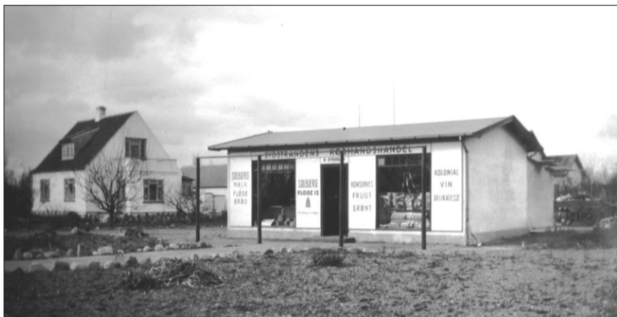
Sommeren 1938. "Sydstrandscenteret", Krudttårnsvej 8.

Lige præcis det sidste er vi meget glade for, da mange jo har ting i "gemmerne" og oplevelser, de gerne vil videregive