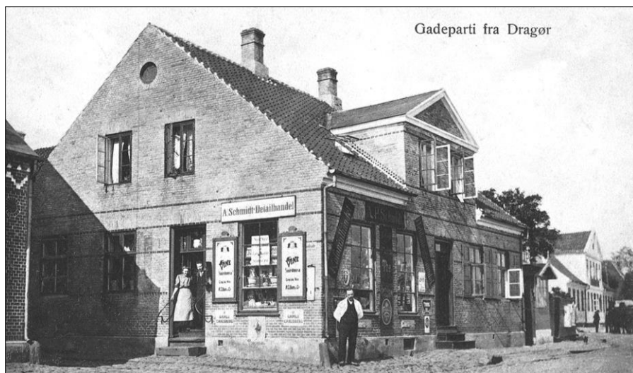
1892. Strandgade 36, hjørnet af Strandlinien.

Vi har nok ikke skrevet den sidste bog, vi er vist blevet bidt af at kæde vore egne erindringer ind i de større sammenhænge. For ofte er det den røde tråd i bøgerne. Arkiverne rundt omkring bruger vi som kilder til dokumentation.