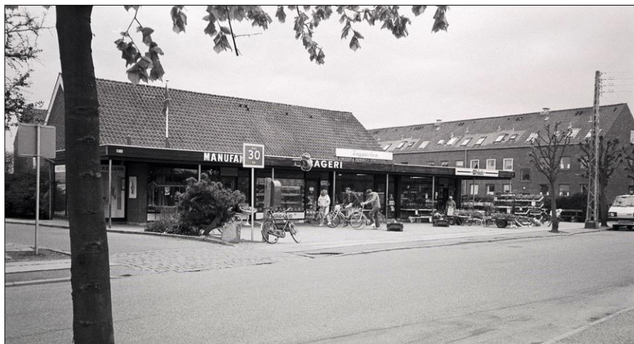
1987. Engparkens butikscenter.

Det lander så i Historisk Arkiv til glæde for både fremtidige generationer og os, der er her nu.