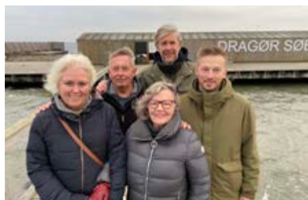
"De Dragør Vandhundes" bestyrelse, som havde lagt et meget stort arbejde i forberedelserne til festen, poserer på Dragør Søbad den 30. december 2019.

Bogen er på 80 sider og kan erhverves af medlemmer af Dragør Lokalhistoriske Forening med medlemsrabat, så længe lager haves.