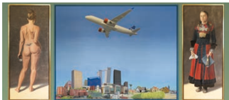
Peter Carlsens Amagermaleri indgår som et element i fællesudstillingen

Endvidere forventer man at kunne deltage med et større foredrag.