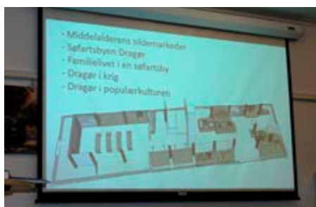
Model for indretningen på første sal med fem temaudstillinger.