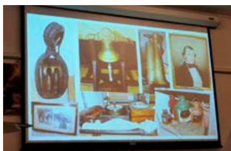
Under temaet "Dragør i Krig" bliver der vist genstande og film på video.

Dragør Museum, der har været under en tiltrængt renovering og ombygning gennem længere tid, forventes åbnet i sommeren 2020 med helt nye udstillinger.