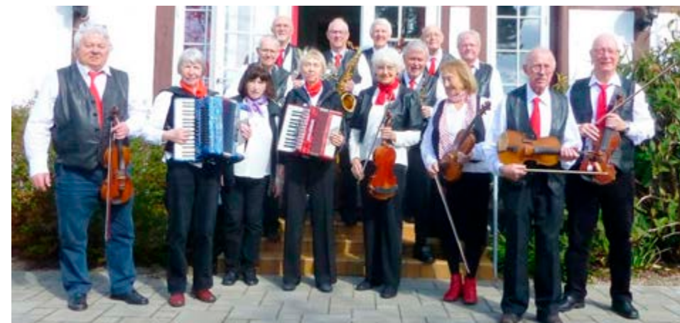
Helt fra foreningens spæde start medlemmerne båret deres karakteristiske "uniform" med sorte læderveste og røde slips.

Det bliver utvivlsomt en både munter og festlig aften.