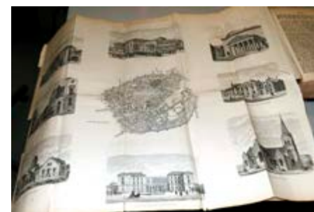
Den første udgave af Trap fra 1960 indeholdt meget fine detaljerede kort.

Dragør Lokalhistoriske Forening har været formidler af bogen ved at købe i alt 130 eksemplarer, som er videresolgt til medlemmerne med stor rabat (pris 130 kr.). Efter foredraget er der blot otte eksemplarer tilbage, som sælges ved kommende medlemsmøder. Dog uden dedikation fra aftenens foredragsholder, som der var mulighed for efter foredraget.