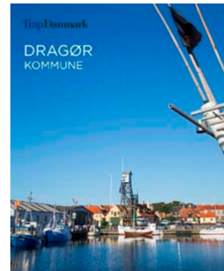
Bogens forside er et smukt foto af Dragør Havn set fra vandet med Lodstårnet i centrum.