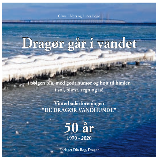
Jubilæumsbogen med omslagsfoto med vintermotiv taget af Jørgen D. Petersen.