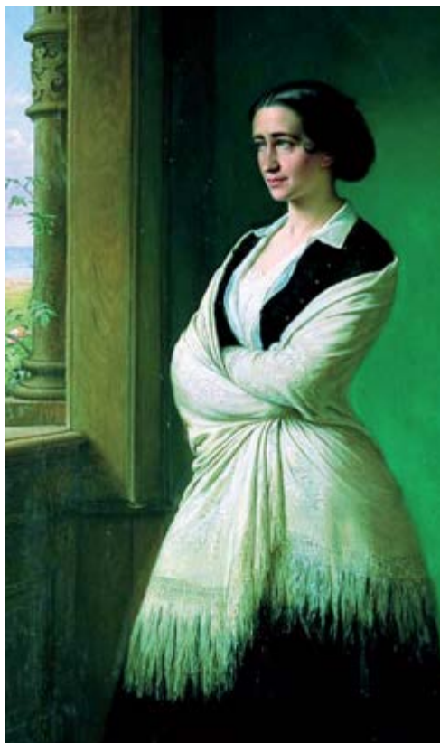
Johanne Luise Heiberg Kopi af maleri af W. Marstrand