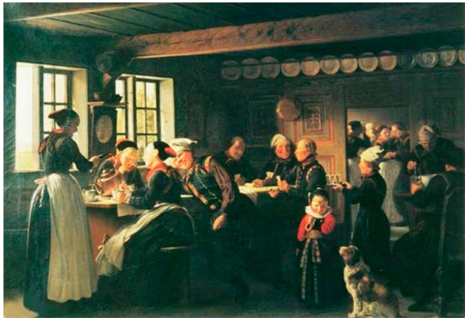
Maleri af Julius Exner 1854