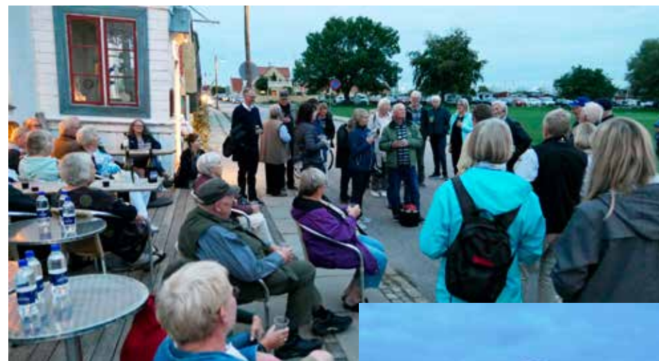
Nam-Nam havde velvilligt stillet borde og stole til rådighed for byvandringen.

Som tak for et levende og glimrende foredrag overrakte formanden et eksemplar af den netop udgivne bog "Theodor Philipsens Saltholm – En tidsrejse".