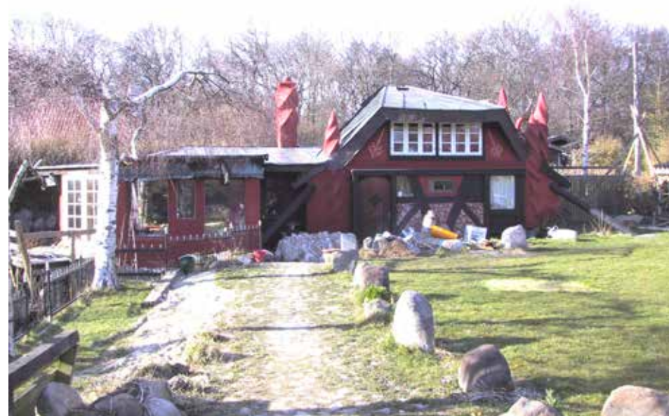
Et af de særprægede huse i Rosenlundkvarteret.

Hør blandt andet om storsmuglerne, der opererede i området. Et mindre "Christiania", kaldte nogle det for mange år siden. Hvad lavede militæret i området 1916-18 og meget mere.