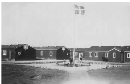
Baggersmindelejren er den eneste tilbageværende af de fem baraklejre på Sydammager.

Aagaard, og det bliver spændende at gå mere i detaljer ved foredraget den 20. november.