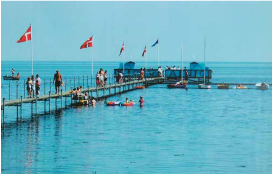
”Danmarks længste badebro” er i dag blevet til Søvangs markante og populære vartegn.

tirsdag den 25. september kl. 16 – 18 i Søvang Sportsklub på Poppelvej 139.