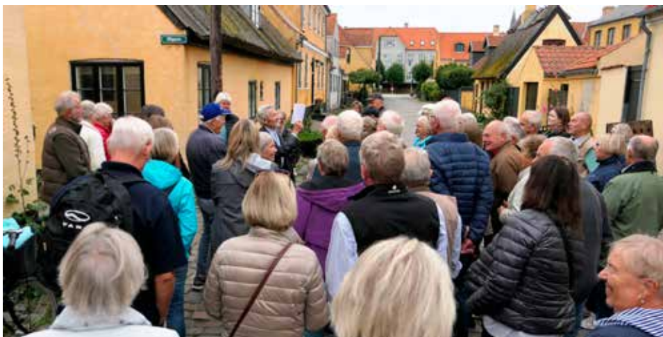
Munter stemning på vej gennem byen.