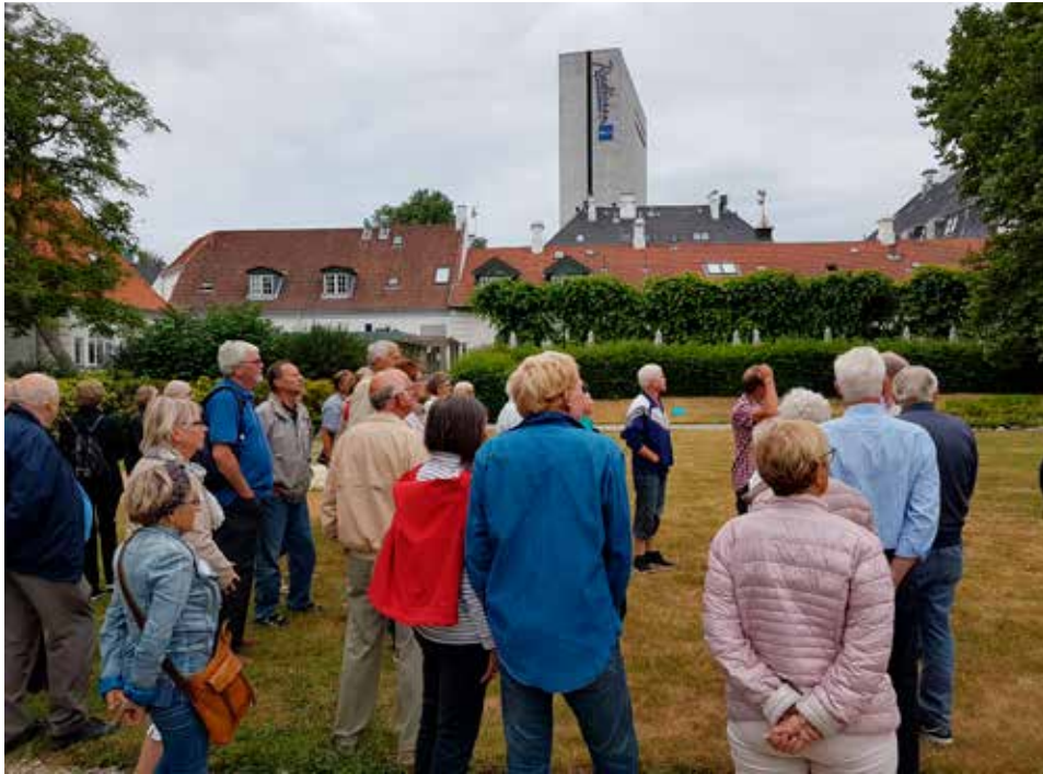
I direktørvillaens imponerende og smukke have er der en op-højet ro, og kun det store hotel vidner om nærheden til Amager Boulevard og den hektiske trafik.