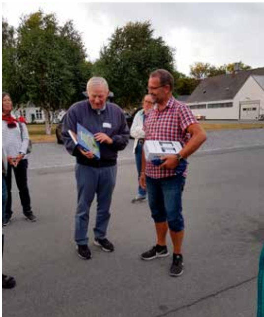
Som en varm tak til foredragsholderen overrakte formanden en vingave samt et dedikeret eksemplar af bogen "Amager i Krig og Fred", hvor områdets militære baggrund er beskrevet.