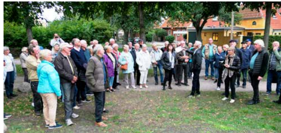
Forbi Blushøj ved Kirkegården hørte vi om glade minder fra barndommen.