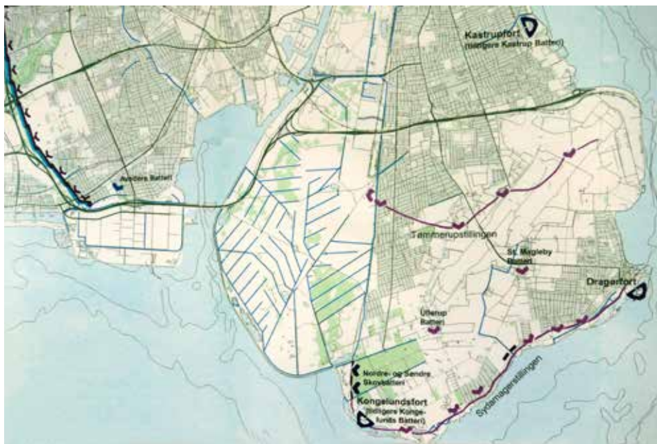
Kort over Tømmerupstillingen og Sydamergerstillingen med angivelse af de forskellige militære anlæg.

Derfor igangsattes et større forsvarsanlæg langs kysten mellem Dragør Fort og Kongelunds Fort, og