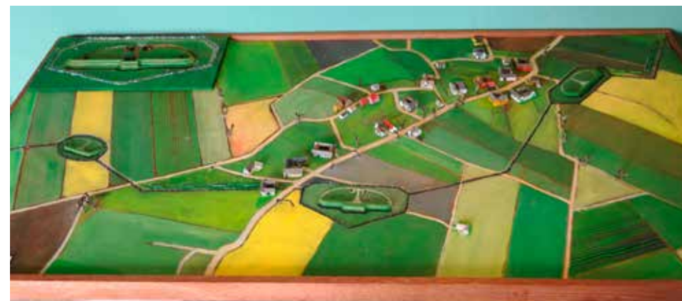
En fin model viser i detaljer, hvordan stillingen gik tværs gennem haver og marker i landsbyerne Tømmerup og Skelgaarde.