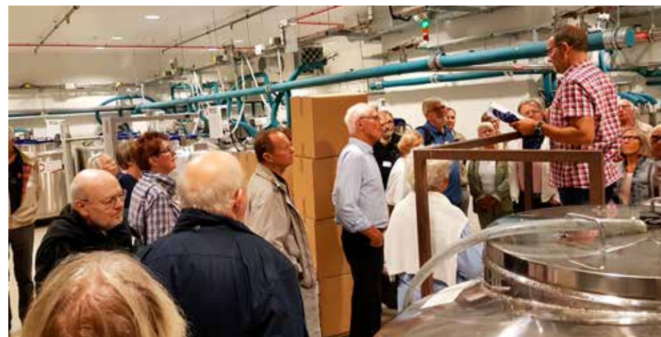
Vi fik også lejlighed til at kigge ind i Danmarks Nationale Biobank, hvor utallige biologiske prøver opbevares under sikre forhold.