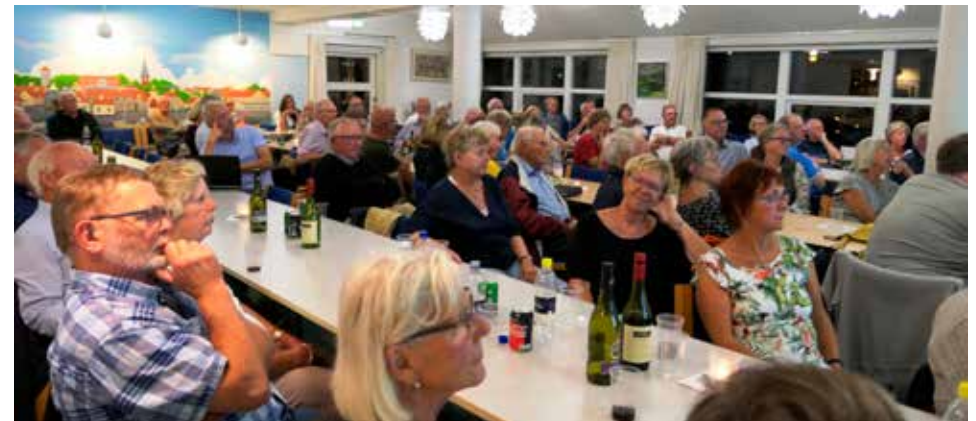
Festsalen var fyldt med interesserede tilhørere som så ofte før ved foreningens arrangementer.

Begge foredragsholderne har en stor viden om Søvang. Dines har gennem tiden interviewet adskillige af