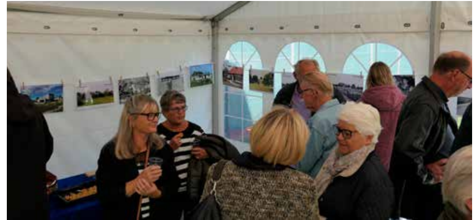
Gaven fra Dragør Lokalhistoriske Forening var 25 laminerede fotos fra Søvang som var ophængt som dekoration i festteltet ved sportsklubben.

Dragør er med sine 12.085 indbyggere nr. 54 på listen.